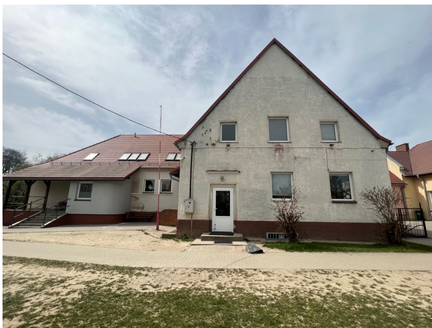
Fot. Obszar opracowania – widok ogólny.