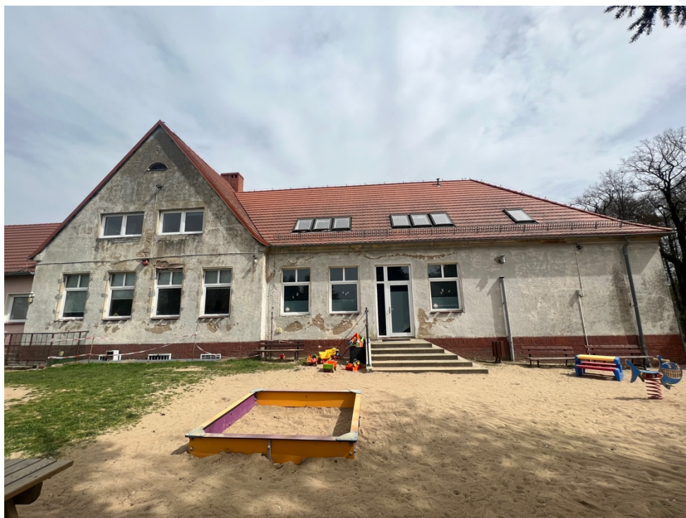
Fot. Obszar opracowania – widok ogólny.