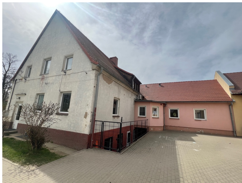
Fot. Obszar opracowania – widok ogólny.