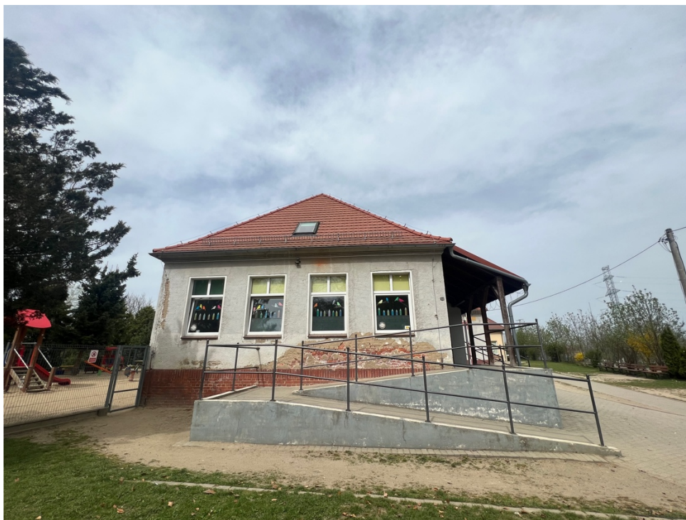
Fot. Obszar opracowania – widok ogólny.